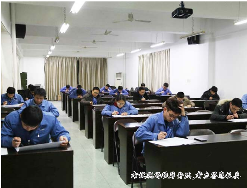
考试现场秩序井然,考生答卷认真

2015年2月6日模具设计职系专业技术资格等级评定专业理论知识笔试考试在模具中心培训室顺利组织,经前期审核符合评定资格的21名模具设计员参加了本次考试。按照《关于组织2014年模具设计职系专业技术资格等级评定工作的通知》内容,本次等级评定范围为冲压模具设计初级、中级及塑胶模具设计初级、中级。组织本次及后续周期性同类人才等级评定工作是合兴集团经过26年发展历程中关于人才培养及管理;尤其是针对专业技术类、技能类岗位员工在明确阶段性能力要求与特征,提供培训指导并周期性组织测评及聘用管理方面的工作探索与完善。