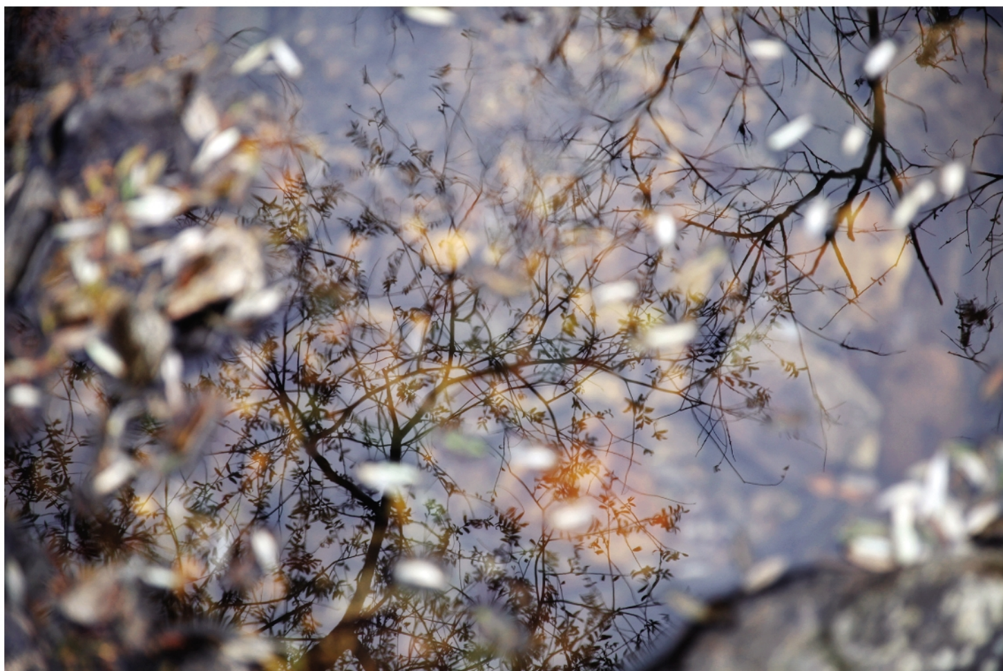
《如影随形》陈威特 / 摄 （合兴摄影社团提供）